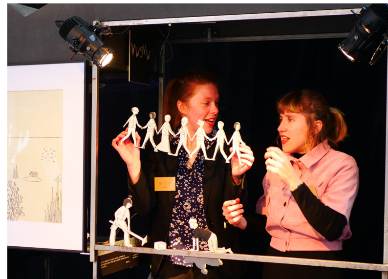
@Jenny Le Goff